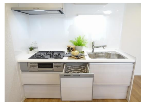
キッチン(食洗器付)